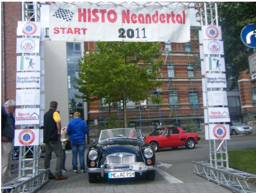
Die MAC Jugend gibt den Start frei